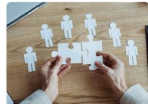
Gestión de Capital Humano

Todos nuestros cursos e instructores están registrados ante la Secretaría del Trabajo y Previsión Social (STPS) Disponible en modalidad online y presencial