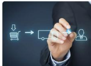
Cadena de Suministro