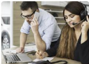
Ventas y Atención al Cliente