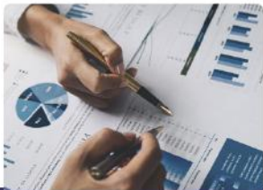
Administración y Finanzas